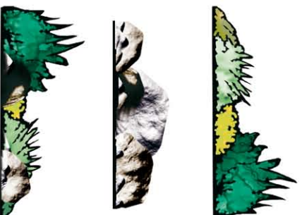
E opcjonalne nakładki na mur (B lub A)

Przed sklejaniem zapoznaj się ze schematem montażu. Po sklejeniu białe krawędzie pozostałe po wycięciu zamaluj ciemnym pigmentem.