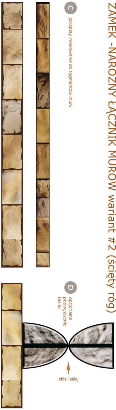
C parapety -mocowanie do segmentów muru